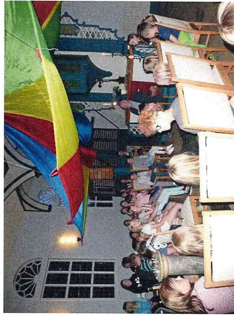
Lust bekommen? Dann ab zu den Eltern und fix anmelden, die Plätze sind begrenzt...

Vorschulkinder dürfen ausschließlich in Begleitung eines Eltern-/ Großeltern teilnehmen. Kinder von Klasse 1.-2. schlafen im Rieseberg Saal, Kinder ab Klasse 3 in der Kirche.